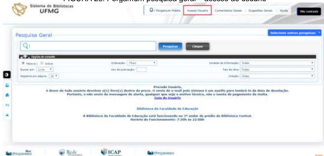
FIGURA 28: Pergamum pesquisa geral – acesso ao usuário