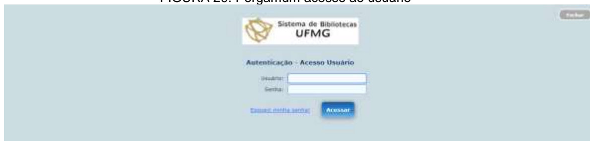
FIGURA 29: Pergamum acesso ao usuário

Na janela de Acesso Usuário, informe o número de usuário e a senha pessoal cadastrada na biblioteca: