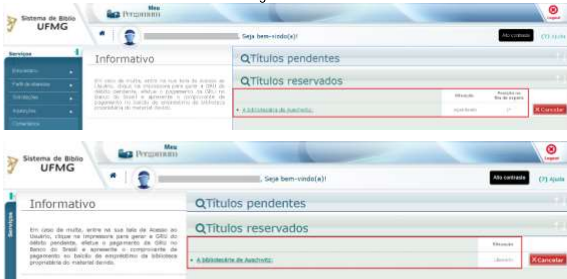
FIGURA 31: Pergamum títulos reservados