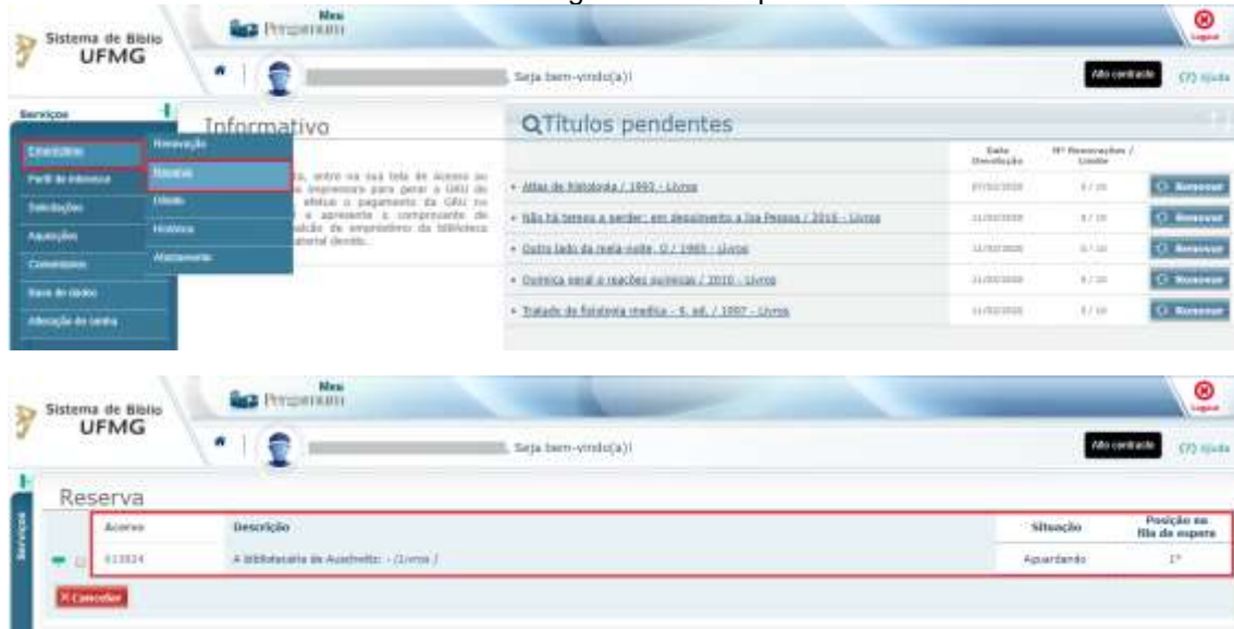
FIGURA 32: Pergamum títulos pendentes