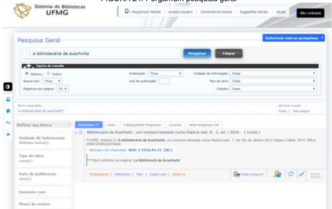
FIGURA 24: Pergamum pesquisa geral

Para reservar materiais acesse a página do catálogo online do Sistema de Bibliotecas https://catalogobiblioteca.ufmg.br e pesquise pelo título que deseja reservar: