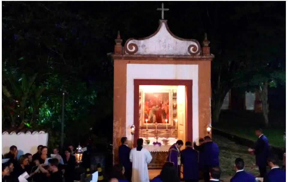
Figura 1 - Cena central Passo Largo do Rosário, Tiradentes/MG.