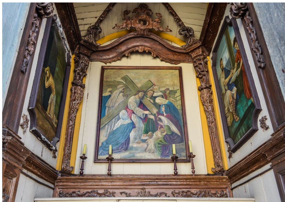
Figura 6 - Cena central Passo Largo do Rosário, São João del Rei/MG.

As cenas descritas daqui em diante estão presentes somente nos Passos de São João del-Rei. No Passo do Largo do Rosário, nós