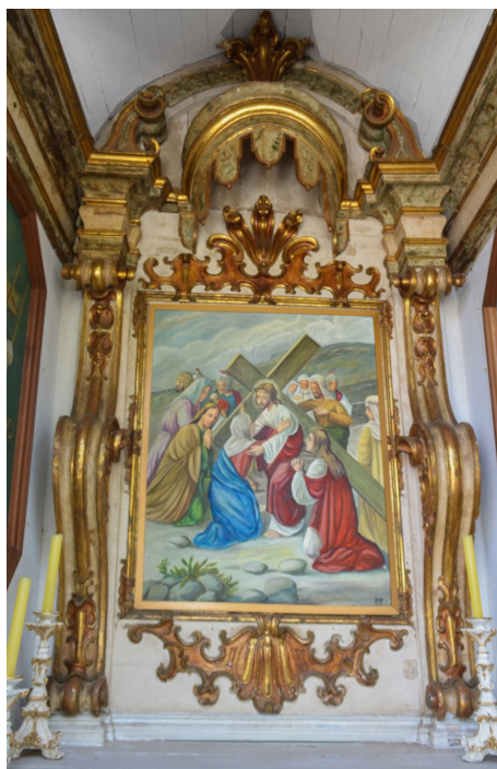
Figura 2 - Pintura central Passo das Mercês, São João del Rei/MG.