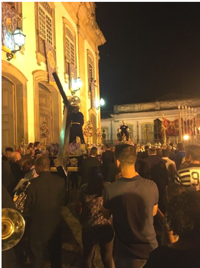
Figura 7 - Imagem do Senhor dos Passos em procissão, São João del-Rei/MG. Fonte: Acervo da autora, 2018.