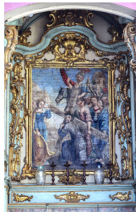
Figura 4 - Pintura central Passo do Carmo, São João del Rei/MG.

ficamos que as cenas intituladas “ Simão Cirineu ajuda a carregar a cruz de Jesus Cristo ”, “ Encontro de Jesus e Maria ” e “ Verônica Enxuga o rosto de Cristo ” foram representadas nas duas séries de Passos de Rua estudados. Essas representações atendem ao estabelecido no decreto papal do século XVIII como a cena 4, “ O Encontro com Maria ”, a cena 5, “ A ajuda de Simão Cirineu ” e a cena 6, “ Encontro com Verônica ”. Ressalta-se que, apesar de recentemente a Igreja recomendar suprimir as cenas 4 e 6, por carecerem de fundamentação nas Escrituras Sagradas, diferentemente da cena 5, essas continuaram a ser representadas e aceitas baseadas nas meditações sobre a Paixão de Cristo.