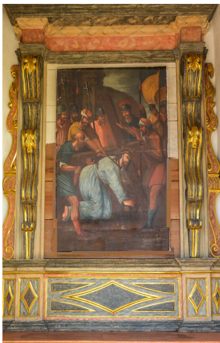
Figura 3 - Pintura central Passo Largo do Pelourinho, Tiradentes/MG.