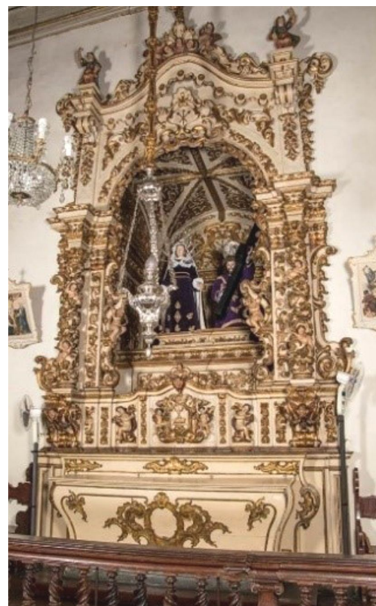
Figura 8 - Retábulo lateral dos Passos na Matriz de Nossa Senhora do Pilar, São João del-Rei/MG.

temos a primeira cena lateral denominada “ Pilatos lavando às mãos ”. Essa cena que atende à estruturação estabelecida como cena 1, “ Cristo condenado ” foi baseada no Evangelho de Mateus (27, 24-26):