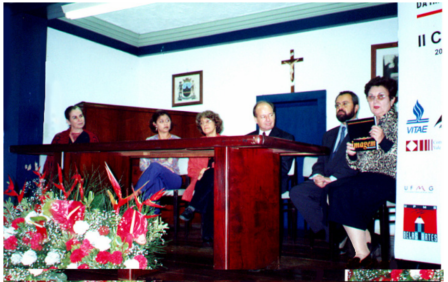
Abertura do Congresso e apresentação da revista Imagem Brasileira na Casa de Cultura de Mariana