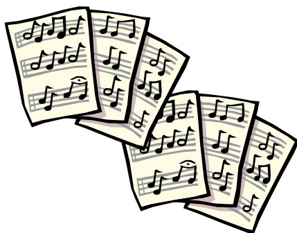
IMAGEM E SOM