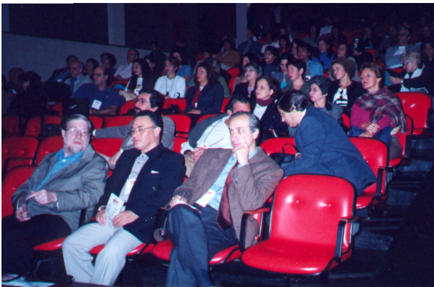
Auditério do SESI-Mariana em uma das sessões do Congresso