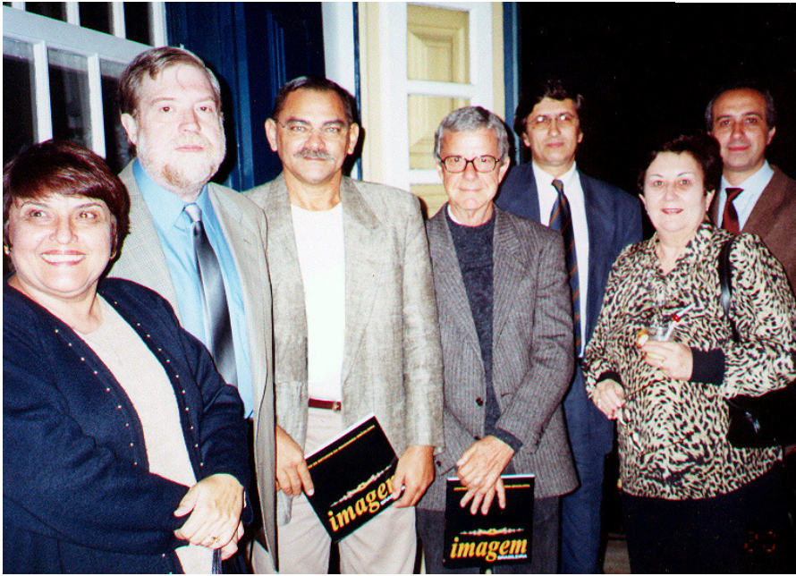
Congressistas no lançamento da revista Imagem Brasileira