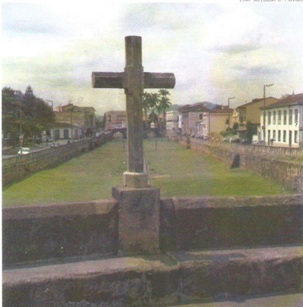
Cruz sobre a ponte do Rosário em São João del-Rei, Minas Gerais