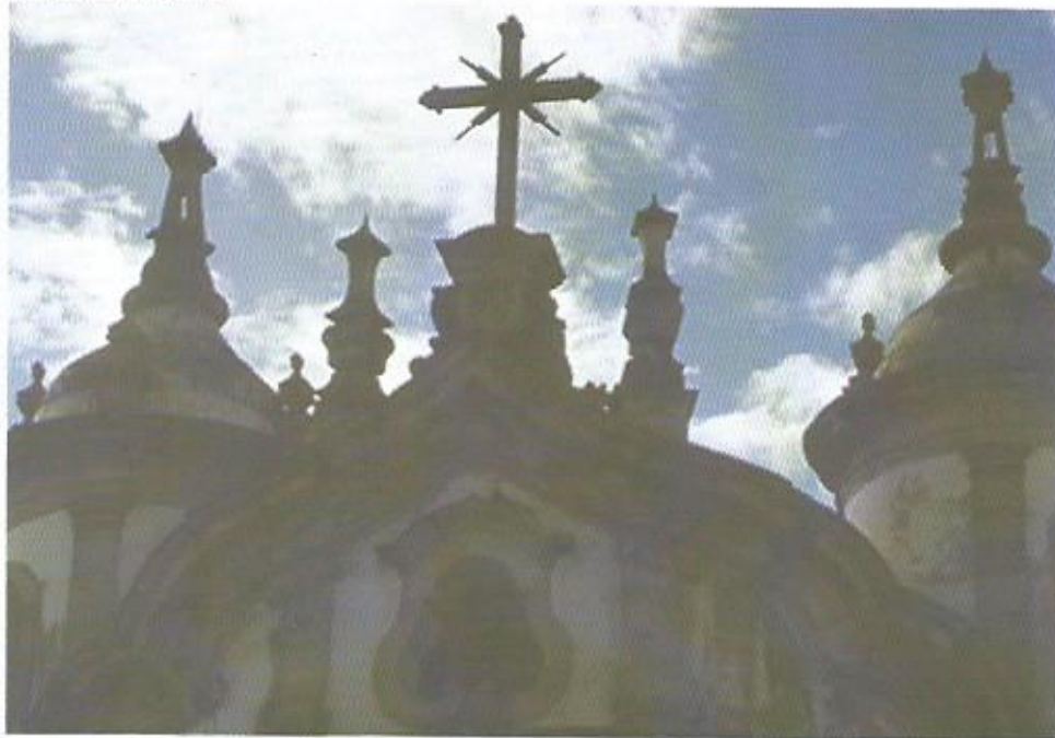
Cruz no frontão Igreja do Rosário, Ouro Preto, MG

exemplificam esse imaginário. Grifos meus.