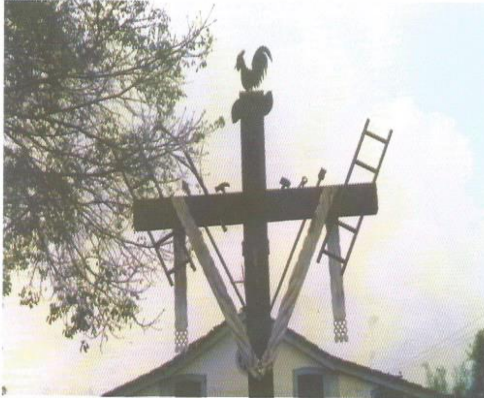
Cruzeiro com símbolos da paixão de Cristo. Igreja do Rosário, Tiradentes, MG

praticantes ou aos seguidores em potencial, maior normatização para a religiosidade praticada, ou seja, a efetiva regulamentação da ação doutrinal de acordo com o Concílio de Trento. No entanto, o que se percebeu ao longo do processo colonizador foi o fortalecimento da "régia" religião católica, 1 não de acordo com as propostas renovadas mas, veiculada através de imensa participação leiga, propiciadora de uma devoção variada, caseira e ao mesmo tempo sociabilizante.