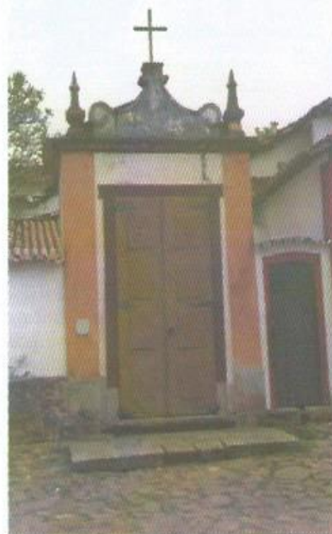
Capela com Passo da Paixão de Cristo, Tiradentes, Minas Gerais