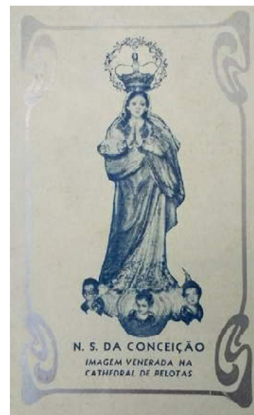
FIGURA 3: Lembrança da festa de N. Sra. da Conceição de 1938, na Catedral de Pelotas.

Como se vê, o perfil da Irmandade da Conceição muda radicalmente após o interregno do conflito civil, coincidindo com o grande impulso de enriquecimento da cidade graças à economia do charque. Muitos cidadãos “grados e livres” que então passam a compor a Irmandade têm também ligação com a Maçonaria que, ao encerrar as atividades de uma de suas lojas, funda no prédio desta o citado Asilo de Órfãos Nossa Senhora da Conceição, para onde é deslocada a histórica imagem original, hoje desaparecida. A imagem de que tratamos neste artigo é a segunda e maior, a qual, na conclusão do segundo templo, terá lugar no altar lateral esquerdo mais próximo ao arco-cruzeiro. A filiação maçônica de vários irmãos e os conflitos entre Maçonaria e Igreja no final do Império, entretanto, levará a mesa administrativa a recusar-se a prestar contas de seu patrimônio ao bispo Barreto como suprema autoridade diocesana, gerando um escandaloso processo judicial e troca de insultos na imprensa (RIBEIRO, 2011).