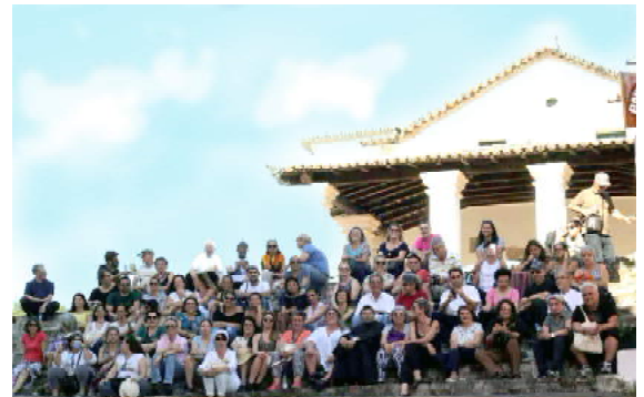
Figura 5: Visita à cidade histórica de Cachoeira.

24 a 28 de outubro de 2017 Salvador, Bahia.