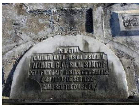
FIGURA 7: Placa afixada no quadro de catacumbas da Irmandade do Rosário, em preito de gratidão ao fundador das mesmas e seu tesoureiro, Manoel Santos. Sem data, cerca de 1900.