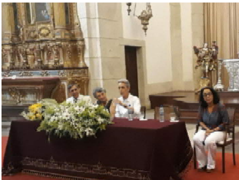
Figura 1: Sessão de abertura no Museu de Arte Sacra.