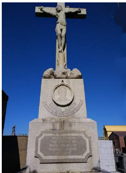
FIGURA 9: O monumental jazigo, esculpido em granito, construído para ossário da Irmandade do Rosário, já como entidade apenas civil, em 1932, sinal de sua vitalidade e poder econômico.

se deduz que outra imagem seria a titular, podendo-se admitir que seria a Senhora do Rosário, cujas dimensões são proporcionais ao altar. Outro fator indicativo é que, em 1932, ano anterior à reforma, a irmandade, existente como entidade civil, constrói um monumental jazigo esculpido em granito (FIG.9), para ossário perpétuo dos irmãos cujos nichos nas catacumbas da Irmandade iam sendo desocupados e relocados. Esse dado nos dá uma pista de que congregou uma parcela economicamente privilegiada da população negra ou mestiça local, capaz de patrocinar um novo altar para sua titular 4 . Entretanto, não é impossível que, já na reforma de 1948-50, a imagem tenha sido retirada de culto e Santa Teresinha ocupado seu lugar, posto que há informações de que Santa Bárbara teria ocupado o pedestal em que aquela aparece na foto. Nessa mesma época, um pároco, conforme depoimento recolhido anos atrás, mandou destruir os bancos que traziam indicação de reservados à irmandade “dos pretos”, interpretando sua presença como um sinal de discriminação, quando fora, ao contrário, uma conquista territorial dos mesmos no espaço do templo comum.