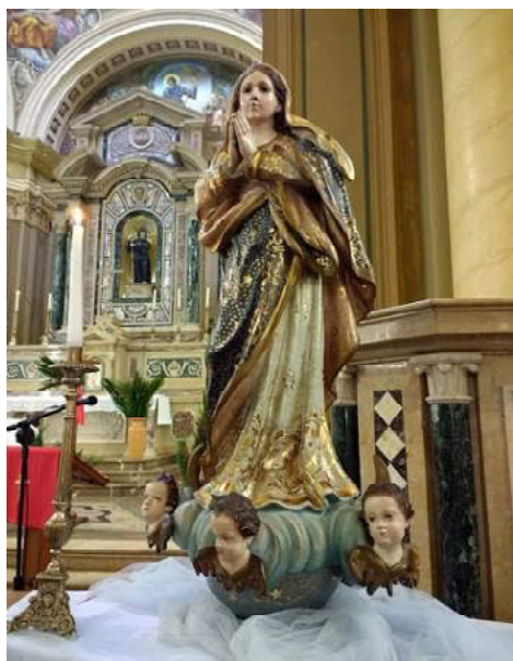
FIGURA 4: Nossa Senhora da Conceição. Ao fundo aparece a atual capela-mor, com as pinturas de Locatelli.

Mesmo tendo ganho a causa no âmbito civil, o sodalício acabou por dissolver-se, outorgando seus bens à Santa Casa de Misericórdia e ao Asilo São Benedito, ao qual coube a imagem de Nossa Senhora, posteriormente devolvida à Catedral (NASCIMENTO, 1989: 128).