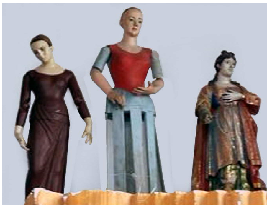
FIGURA 8: Foto da reserva técnica do Memorial Torre Norte, onde aparece a imagem de roca de N. Sra. do Rosário entre as imagens de N. Sra. da Soledade e Santa Bárbara.