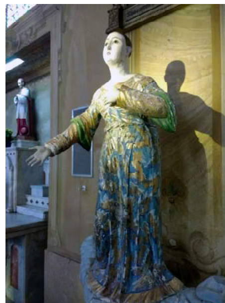
FIGURA 6: Nossa Senhora da Assunção, ou da Glória, durante a exposição do Memorial Torre Norte.

Havendo-se tornado padroeira da Diocese de Pelotas, em virtude da bula de criação desta ter sido emitida pelo Papa Pio X na festa da Assunção, 15 de agosto de 1910,