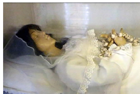
FIGURA 5: Nossa Senhora da Boa Morte (detalhe).

Em 1829, organiza-se outra irmandade de “gente de cor livre e cativa”: a de Nossa Senhora da Assunção e Boa Morte, que, nos mesmos moldes da Irmandade da Conceição, permitia o ingresso de “protetores” brancos; no mesmo ano é adquirida de Portugal a imagem jacente, de vestir e de pequeno porte, de Nossa Senhora da Boa Morte (FIG 5), com a qual se realizava a Procissão do Enterro da Virgem, na vigília da festa da Assunção. As festividades se interromperam durante a Revolução Farroupilha, período em que