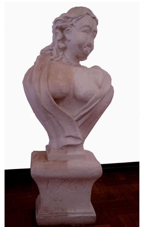
Figura 3: Resultado parcial da limpeza da réplica da Afrodite do Chafariz do Alto da Cruz (Ouro Preto, MG).