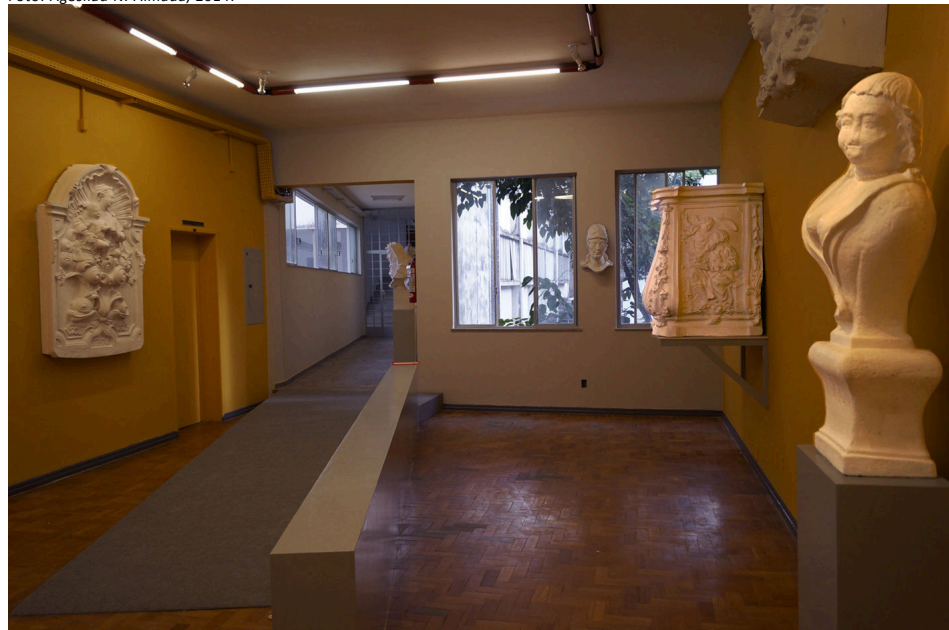
Figura 8: Sala expositiva do MEA-UFMG após a remodelação.

Descartamos a aplicação de um verniz de proteção nas peças, uma vez que as intervenções anteriores (repinturas) e a tinta utilizada no processo de reintegração cromática (tratamento atual), criaram, de certa maneira, uma película protetora sobre o suporte, que facilitará o processo de limpeza futura, que poderá ser facilmente executada com água destilada.