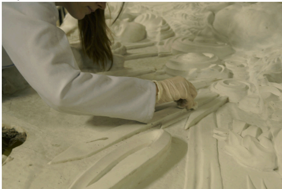
Figura 1: Limpeza química da réplica do medalhão da portada da Igreja de São Francisco de Assis (Ouro Preto, MG).