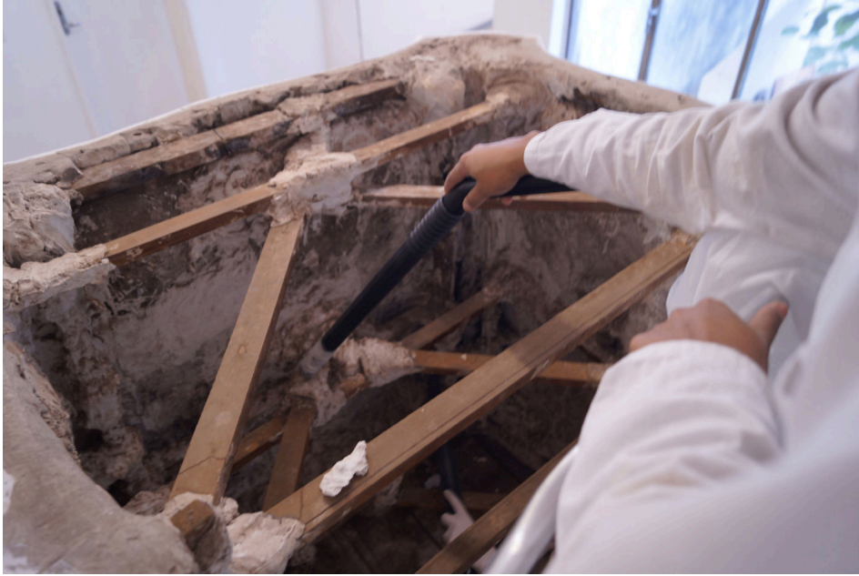
Figura 2: Limpeza mecânica com aspirador de pó do verso da réplica do tambor do púlpito da Igreja de Nossa Senhora do Carmo (Sabará, MG).

Cabe salientar que o acervo do MEA-UFMG é formado também por cópias de obras conhecidas internacionalmente, adquiridas em leilões. Atualmente nas fichas patrimoniais inventariadas pelo MEA-UFMG há informações de peças pertencentes à produção francesa, como por exemplo, Maison Bonnet, que permitem o estabelecimento da relação das réplicas com suas matrizes originais estrangeiras; sendo que, algumas delas remetem ao Museu de Louvre, localizado em Paris, França (SOUZA, 2013).