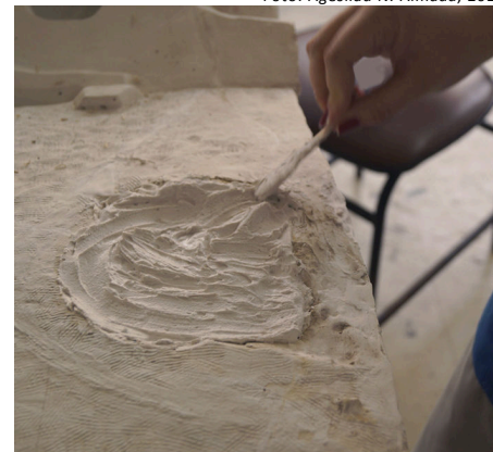
Figura 5: Preenchimento parcial da lacuna existente na réplica do Medalhão da Igreja de São Francisco de Assis (Ouro Preto, MG).

no tempo em que foram desenvolvidas, na primeira e na segunda metade do século XX, sobretudo se comparado a hoje, em que materiais mais modernos e de mais fácil manipulação são utilizados para a confecção de réplicas como é o caso do silicone.