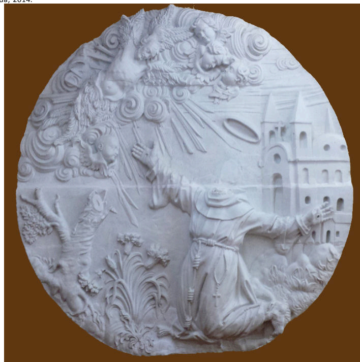
Figuras 6 e 7: Comparação entre o antes e o depois da restauração; Réplica do medalhão da portada da Igreja de São Francisco de Assis (Ouro Preto, MG).

do Carmo (Ouro Preto). Outra possibilidade de obra identificada pode estar na escultura do profeta Jonas que, devido ao seu tamanho e ao local em que se encontrava, não foi possível movimentá-la para inspecioná-la na sua parte inferior. É possível supor que essas peças faziam parte do acervo didático da disciplina ministrada pelo professor Meschessi. Por isso, a falta de preocupação em identificá-las, visto que é presumível que não havia a pretensão de removê-las da instituição.