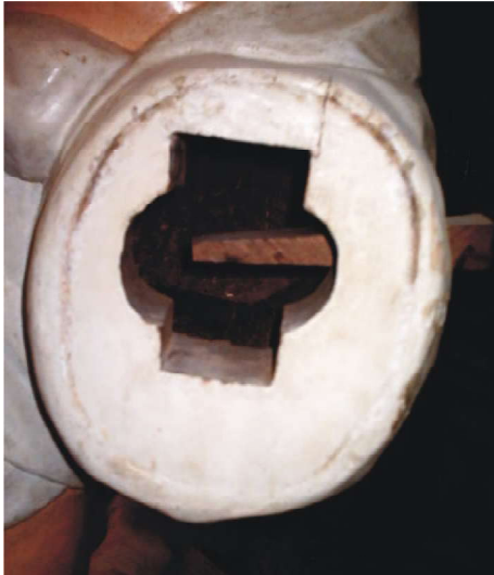
Figura 5: Senhor Bom Jesus dos Passos – Detalhe das articulações dos braços Foto: Kleumanery Melo, 2006.

dos bigodes nas laterais do sulco naso-labial e das barbas, que deixam o queixo a mostra, e nascem na altura dos lóbulos inferiores das orelhas. Frequentemente, os policromadores tentam encobrir estas características, provavelmente por uma questão de gosto pessoal, aumentando o tamanho das barbas, levando sua implantação até o meio das orelhas, e bigodes unidos abaixo do nariz.