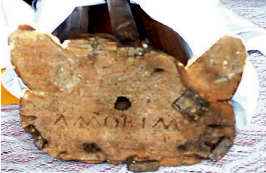
Figura 6: Assinaturas na base da imagens.

estudo mais aprofundado sobre o trabalho deste artista. É um trabalho que necessita de muita pesquisa e dedicação uma vez que as informações encontram-se dispersas e acesso as imagens e informações é muito restrito e algumas imagens apresentam muitas repinturas e algumas intervenções que descaracterizam a técnica original. Entretanto, salientamos a importância deste estudo para registrar a importância da imaginária pernambucana no cenário artístico nacional do século XIX.