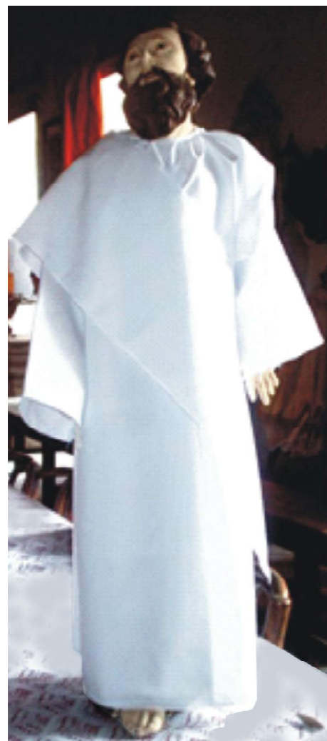
Figura 2: São Tiago Maior. Foto: Kleumanery Melo, 2006.

Sua devoção não é tão comum no Brasil, e poucas imagens são encontradas sob essa invocação. O local onde essa devoção é mais forte é na cidade de Mossoró no Rio Grande do Norte, onde