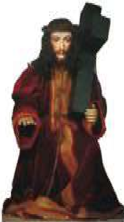
Figura 1: Senhor Jesus do Passos.

então o método desenvolvido pelo crítico de arte italiano Giovanni Morelli (1816-1891).