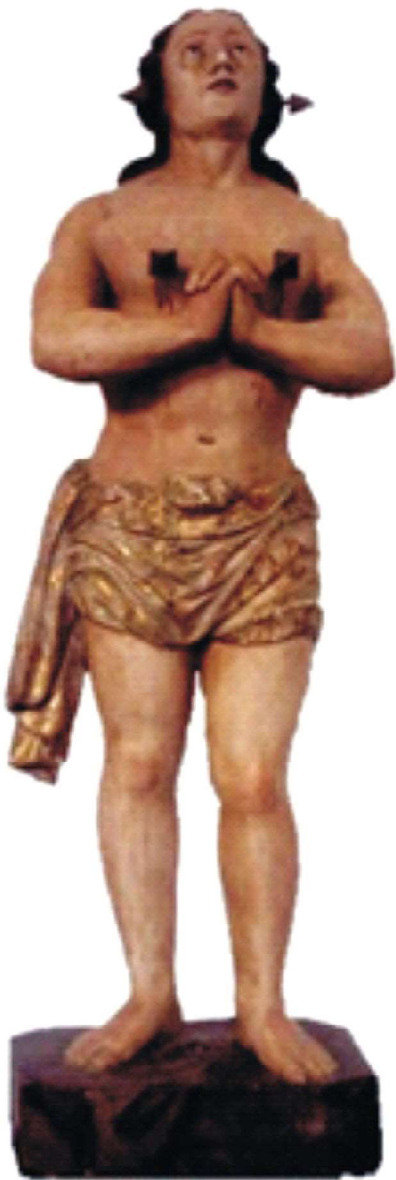
Figura 3: São Manoel da Paciência. Foto: Kleumanery Melo, 2006.

existe uma paróquia dedicada a este santo. Durante anos, a imagem ficou entronada no altar-mor da Igreja do Terço, porém, após um roubo, esta quando foi recuperada passou a ser guarda em uma sala trancada no primeiro andar da Igreja.