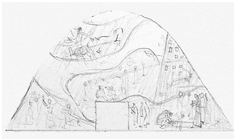
Figura 4: Cândido Portinari. Esboço para mural São Francisco despojado-se das vestes. Grafite s papel, 1944.

No esboço 212 [Fig. 04], o artista elabora dois episódios da vida de São Francisco. Um seria a representação da Visão da Carruagem de Fogo (lado esquerdo superior do desenho), episódio no qual um grupo de franciscanos teria visto São Francisco em uma carruagem de fogo no céu. O outro momento retratado é "A homenagem do homem simples", que ocupa o canto direito do estudo. É nítida a semelhança das representações com os afrescos de Giotto.