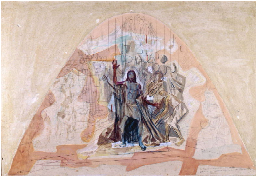
Figura 8: Cândido Portinari. São Francisco. 1944. Aquarela. 59 x 90cm. Belo Horizonte.

Podemos ver que, apesar de esta ser uma obra moderna, o pintor utiliza de técnicas sobre perspectiva aprendidas na academia: 15 o grupo de pessoas ao fundo foi disposto em tamanho menor que os demais personagens para pontuar a distância destes em relação à cena que se passa na parte da frente do painel. A sensação de profundidade é reforçada pela estruturação das laterais, esquerda e direita, em "colunas" que vão diminuindo à medida que alcançam o fundo da cena. Para reforçar o expressionismo, Portinari deforma as figuras; a deformação dos pés e das mãos, perceptível principalmente na mulher sentada com o braço sobre a cabeça, é uma característica muito comum nas obras de Portinari. O fundo geometrizado observado no painel também está presente nas obras da série Os Profetas (1944) que Portinari pintou para a rádio Tupi de São Paulo.