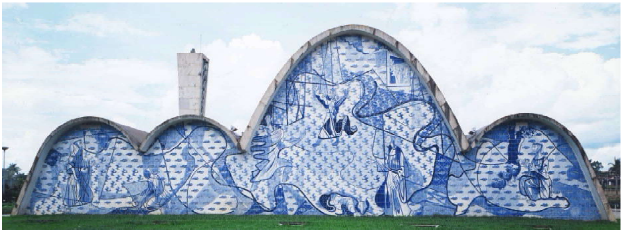
Figura 1: Cândido Portinari. São Francisco. 1944. Painel de azulejos. 750 x 2120 cm Igreja de São Francisco de Assis, Belo Horizonte.

trabalhado de acordo com os aspectos culturais de determinada época em associação à destinação de cada obra de arte. Para conferir uma nova significação ao tema, o artista buscará um “método de composição” igualmente novo. A feitura de uma outra obra é apenas justificada se esta for detentora de uma interpretação diversa, resultado de uma mudança formal criada por meio de um sistema de representação que envolve desde as cores à disposição dos elementos na cena.