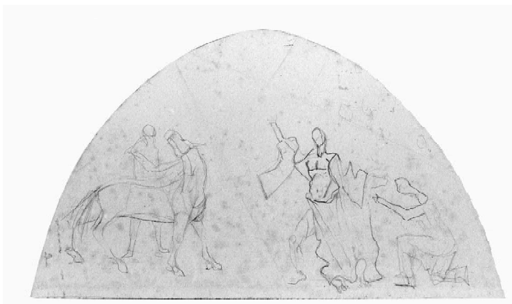
Figura 5: Cândido Portinari. Esboço para mural São Francisco despojado-se das vestes. Grafite s papel, 1944.

No esboço 212 [Fig. 04], o artista elabora dois episódios da vida de São Francisco. Um seria a representação da Visão da Carruagem de Fogo (lado esquerdo superior do desenho), episódio no qual um grupo de franciscanos teria visto São Francisco em uma carruagem de fogo no céu. O outro momento retratado é "A homenagem do homem simples", que ocupa o canto direito do estudo. É nítida a semelhança das representações com os afrescos de Giotto.