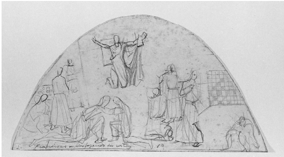
Figura 6: Cândido Portinari. São Francisco. 1944. Grafite sobre papel. 14 x 25cm. Igreja São Francisco de Assis. Belo Horizonte.