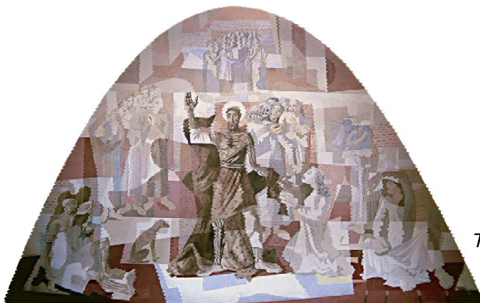
Figura 3: Cândido Portinari. São Francisco se Despojando das Vestes. 1945. Têmpera sobre argamassa. 750 x 1060cm. Igreja São Francisco de Assis. Belo Horizonte.

Ao se acompanhar a história de São Francisco de Assis, percebe-se a inexistência de uma coerência cronológica 11 na obra feita por Portinari. Como proposta de análise da narrativa é possível iniciá-la da esquerda para a direita. A primeira representação estaria de acordo com Giotto, Homenagem a um homem simples, mas na sequência deveria aparecer não a “Domesticação do lobo de Gubbio”, mas a “Pregação aos pássaros”. A construção de uma narrativa não linear, com a contraversão da ordem das cenas da vida do santo, foi uma escolha de Portinari, possível pelo seu conhecimento integral da história de São Francisco de Assis.