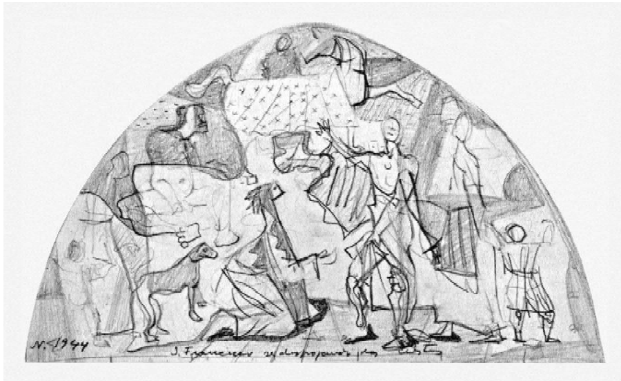
Figura 7: Cândido Portinari. São Francisco. 1944. Grafite sobre papel. 14 x 25cm. Igreja São Francisco de Assis. Belo Horizonte.

vigorosa de São Francisco”, presente no painel interno da igreja, “não deixa de lembrar, em seu aspecto colossal e ‘terrível’, a postura do cristo do Juízo Final da Capela Sixtina” (FABRIS, 1990, p. 60). Também nesse esboço, Portinari dá início ao estudo da perspectiva: do santo com relação ao fundo, do santo com relação às figuras ao seu redor e das figuras com relação ao fundo. No esboço 215, as figuras já estão colocadas no lugar onde ficarão de forma permanente e o São Francisco se apresenta mais jovem. É a partir desse esboço que Portinari irá envelhecê-lo, somando-lhe as características franciscanas e caminhando para a finalização do painel.