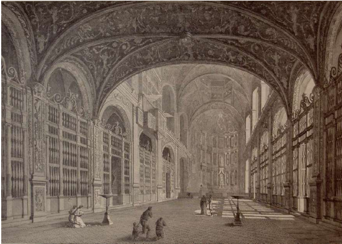
FIG. 1. Alexandre de Laborde. Voyage pittoresque et historique de l'Espagne (I. La Principauté de Catalogne) . París: Pierre Didot, 1806, pl. XXIV. Interior de la iglesia de Montserrat. Dibujo de François Ligier; grabado de Jean Baptiste Réville.

El primitivo camarín del s. XVI de Montserrat constaba de una estancia de la primera planta flanqueada por otras dos estancias –todas con ventanas exteriores hacia levante–, obtenidas detrás del ábside y comunicadas mediante escalera interior con la sagristía de la planta baja (FIG. 2). De hecho el camarín se concebía básicamente como una dependencia de la sagristía –la misma funcionalidad que de entrada tuvo también el ya citado camarín del retablo de Guadalupe (1614), unos cuantos años posterior al de Montserrat (1593)–; se entendía como un espacio adecuado para los frecuentes cuidados y los periódicos cambios de ropaje y adornos que precisaba el culto a la Santa Imagen, y a la vez como un espacio idóneo para almacenar el ajuar utilizado en dichas operaciones: túnicas y mantos del vestuario postizo, coronas, joyas, etc. 15