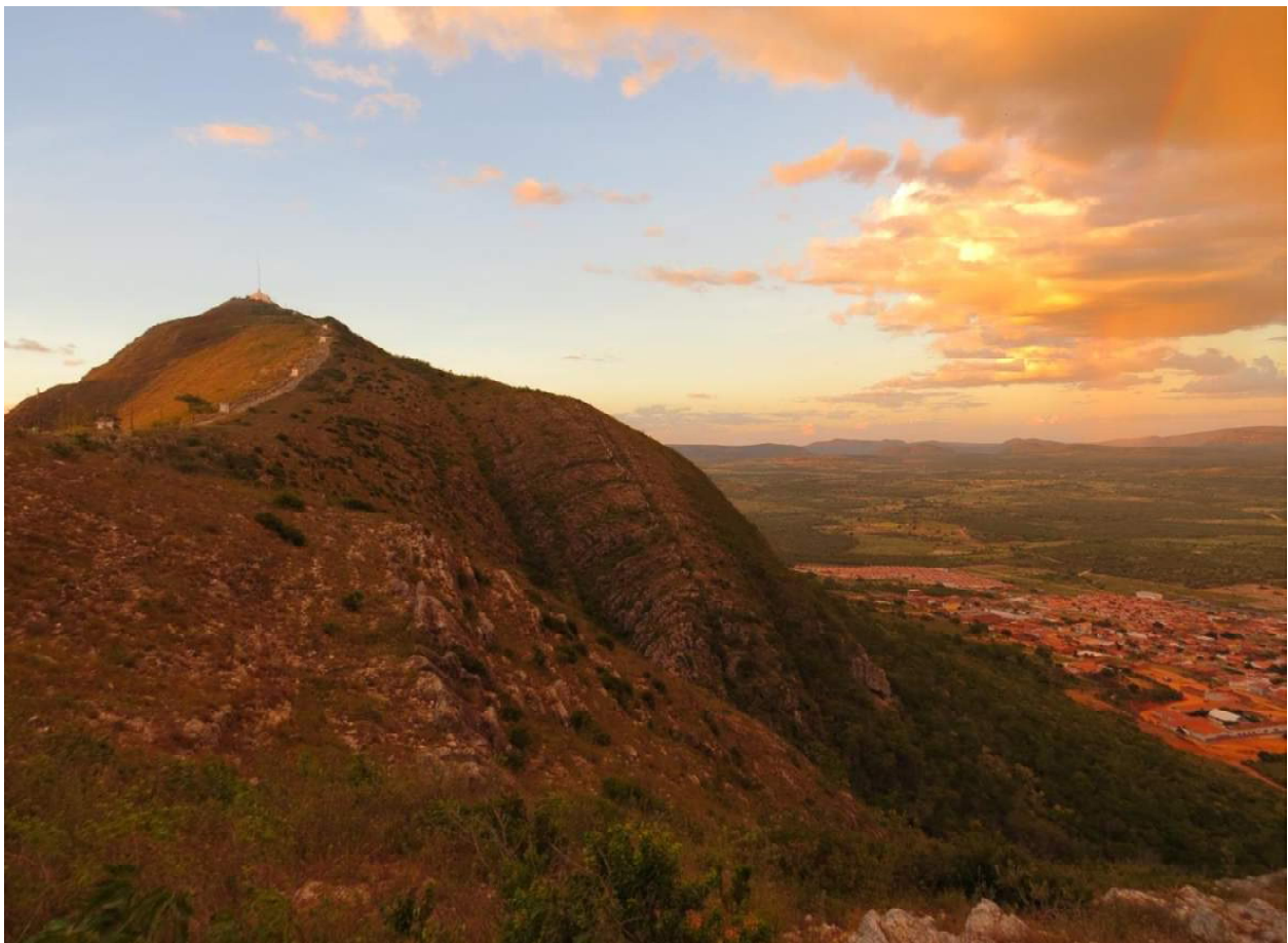
Figura 1- Santuário da Santa Cruz Monte Santo.