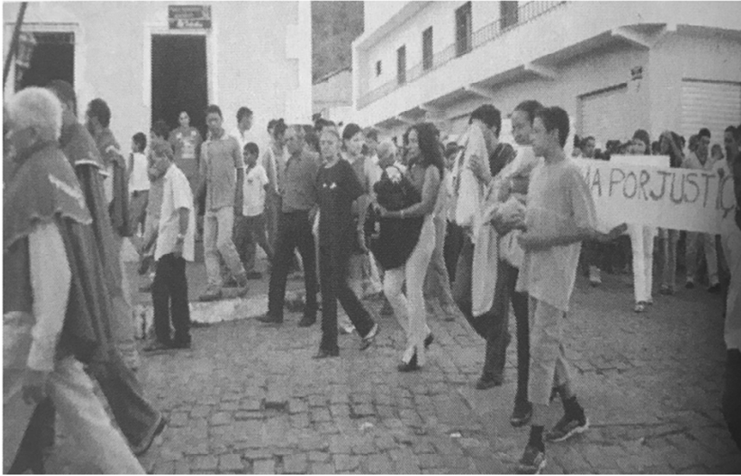
Figura 6 - Procissão/protesto com os destroços das imagens do Senhor dos Passos e Nossa Senhora das Dores, Monte Santo – BA