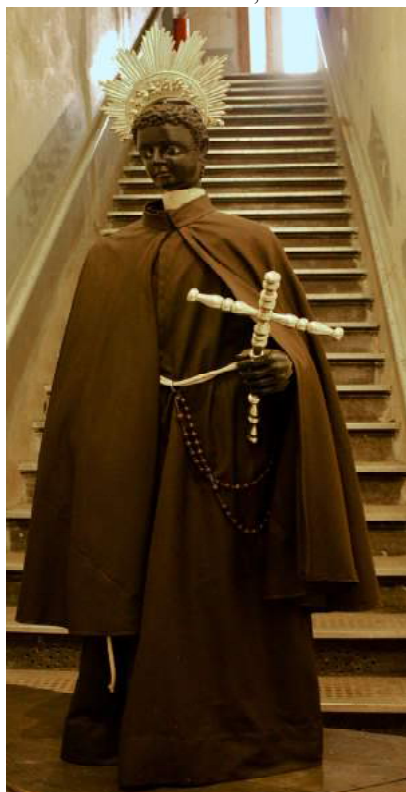
Figura 4 - Santo Antônio de Categeró (imagem de vestir). Venerável Ordem Terceira de São Francisco da Penitência São Paulo, SP