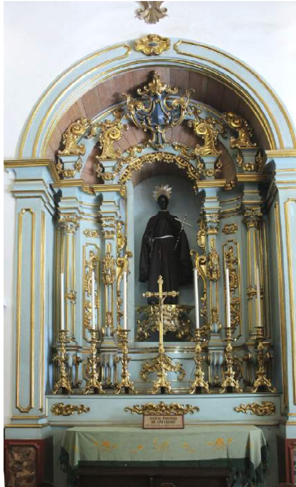
Figura 6 - Retábulo de Santo Antônio de Categeró (retábulo da nave) com a imagem. Igreja da Venerável Ordem Terceira de São Francisco da Penitência - São Paulo, SP.