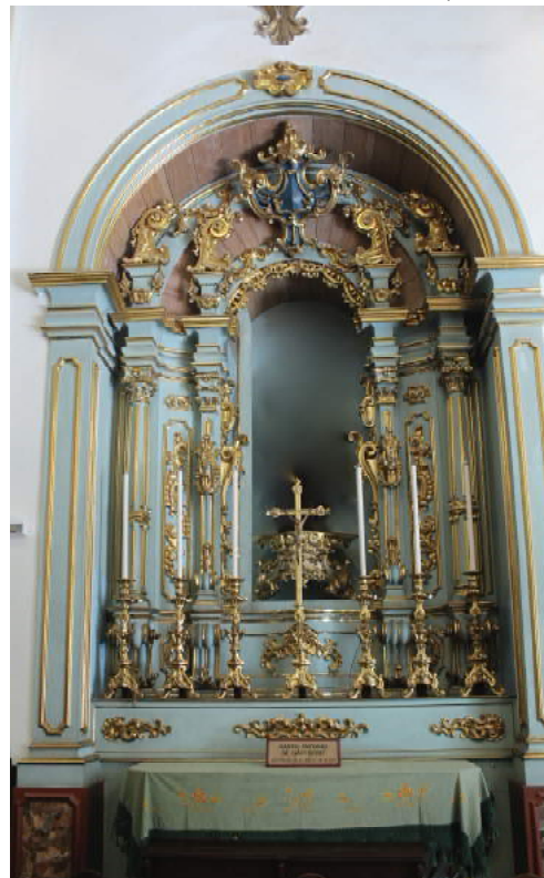
Figura 5 - Exemplo de retábulo sem a imagem. Retábulo de Santo Antônio de Categeró (na nave). Venerável Ordem Terceira de São Francisco da Penitência. São Paulo, SP.