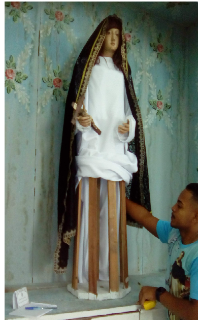
Figura 7 - Santa Rosa de Lima (Detalhe) Séc. XVIII-XIX, autor desconhecido. Imagem em tamanho natural. Ordem Terceira de São Domingos.