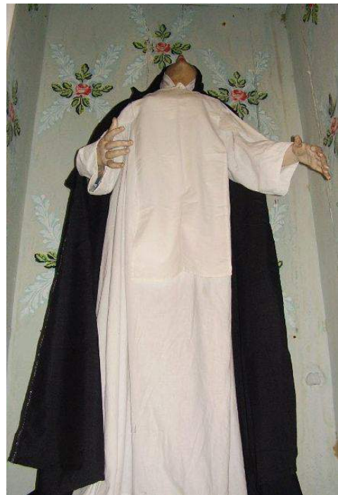
Figura 5 - Santa Margarida de Castela Séc. XVIII-XIX, autor desconhecido. Imagem em tamanho natural. Ordem Terceira de São Domingos.