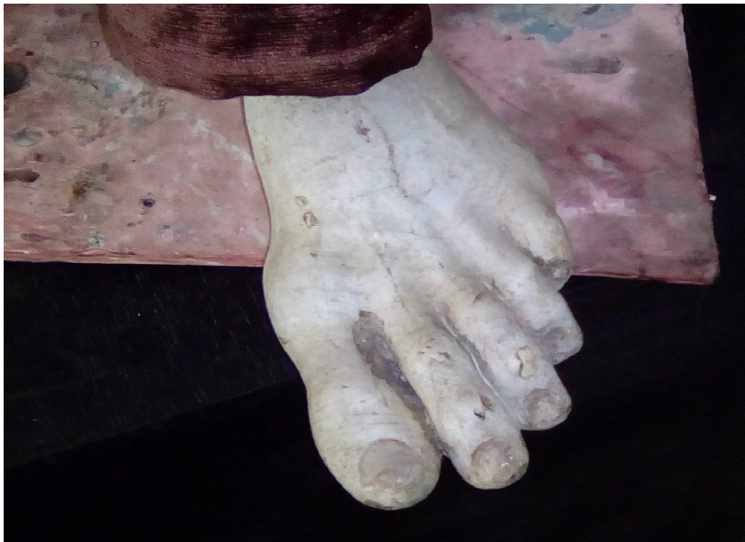
Figura 8 - São Francisco (Detalhe) Séc. XVIII-XIX, autor desconhecido. Imagem em tamanho natural Ordem Terceira de São Domingos.

Um exemplo pode ser constatado em um detalhe da imagem de Francisco de Assis (Figura 8): os pés, que aparecem por debaixo do hábito marrom, permitem reconhecer que o autor, na execução do trabalho, esteve imbuído do significado que o andar descalço teve na conversão de Francisco e na força que tal gesto conferiu à sua mensagem de questionamento dos valores materiais. Por isso o exagero no tamanho e a dramaticidade da forma.