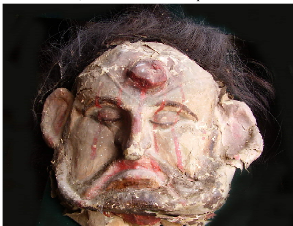
Figura 1 - Cabeça de Golias. Séc. XVIII-XIX, autor desconhecido. Papel machê. Ordem Terceira de São Domingos.

Entre as figuras da abertura conservou-se a cabeça de Golias 2 uma peça em papel machê em tamanho agigantado (Figura1) que expõe a frente do filisteu atingida pela pedra atirada da funda de Davi, conforme descrito em 1 Samuel 17 (BÍBLIA, 2011, p. 412-415). Seguiam-se a essa parte introdutória 11 andores. Todas as imagens que figuraram nestes foram preservadas 3 . O conjunto compreende, além das imagens do Senhor do Triunfo e de Nossa Senhora do Rosário, as representações de santos(as) e beatos(as). São todos dominicanos (frades, monjas ou terceiros), à exceção de um, franciscano, e todos são da Europa (Espanha, França, Itália e Portugal) à exceção de uma santa latina.