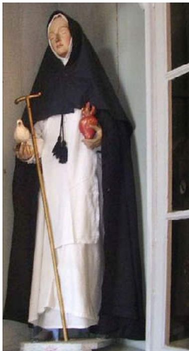
Figura 4 - Santa Hosana de Mântua. Séc. XVIII-XIX, autor desconhecido. Imagem em tamanho natural. Ordem Terceira de São Domingos.

Um dos andores de maior apelo dramático era o que trazia a mística Hosana de Mântua em êxtase diante do Cristo Crucificado reproduzindo a postura característica de arrebatamento espiritual (Figura 4). Identificada como santa, a beata levou uma vida de reflexão e caridade na Itália do século XV. A imagem do crucificado, uma escultura em madeira, traz o braço direito despregado da cruz, como que abraçando a figura da santa.