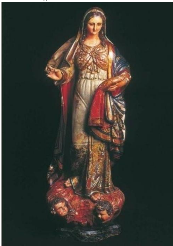
Figura 4 – Nossa Senhora da Estrela