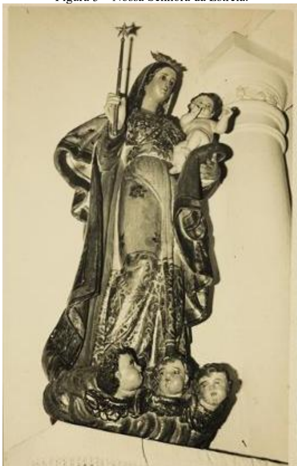
Figura 3 – Nossa Senhora da Estrela.