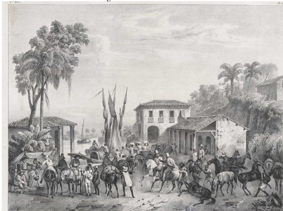
Figura 1 – Porto da Estrela