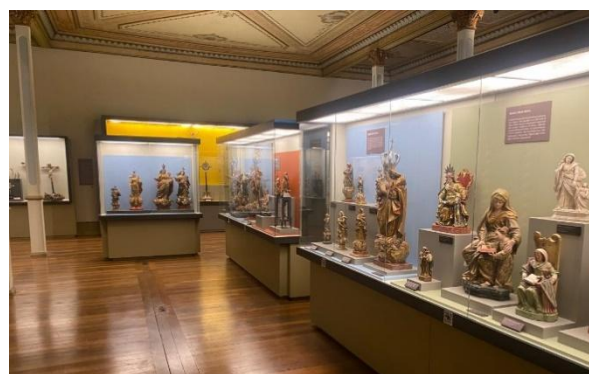
Figura 6b – Sala das Colunas do Museu Mineiro