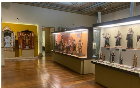
Figura 6a – Sala das Colunas do Museu Mineiro

A inauguração do Museu Mineiro ocorreu no dia 10 de maio do ano de 1982. Desde então, as obras da Coleção Geraldo Parreiras sempre estiveram na composição das exposições permanentes do museu, desfrutando de uma posição de destaque dentro do acervo. Atualmente, as obras da Coleção Geraldo Parreiras encontram-se expostas na Sala das Colunas do Museu Mineiro (Figuras 6a e 6b). Apenas 13 obras dessa coleção estão guardadas na reserva técnica do museu.