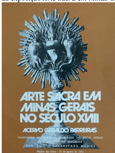
Figura 4 – Catálogo da exposição Arte Sacra em Minas Gerais no Século XVIII

com catálogo contendo fotografias das obras e textos elaborados por Jair Afonso Inácio, referentes à iconografia, época e estilo de cada obra.