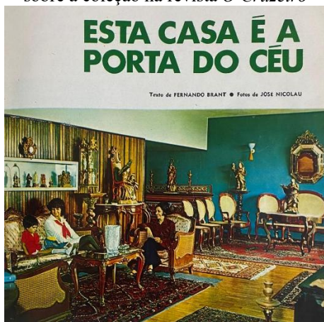
Figura 2a – Página de apresentação da matéria sobre a coleção na revista O Cruzeiro