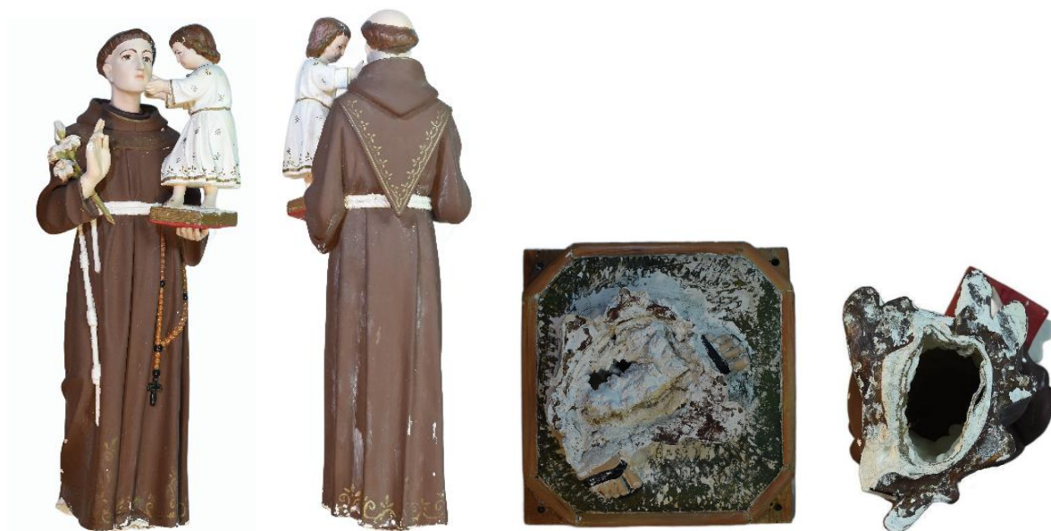
Figura 3 – Imagens do Santo Antônio: frente, verso, base e parte inferior