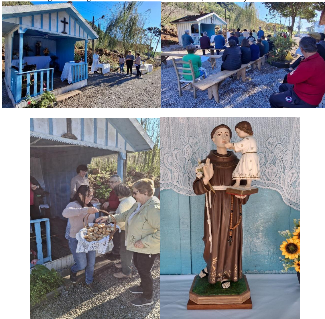
Figura 5 – Imagens da Solenidade de Santo Antônio, no dia 13 de junho de 2025

Houve também a bênção dos pãezinhos, tradição que envolve a história desse Santo. Alguns devotos fazem promessas, doam os pães para serem abençoados e distribuídos para as pessoas. Após a missa solene, a comunidade festejou com a partilha de pão, salsichão, frango assado, chá e café. Uma das autoras teve a oportunidade de participar dessa festividade.