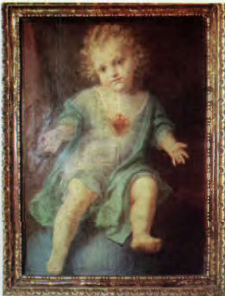
Menino Jesus, pintura sobre tela. Século XVI. Itália

próprio e do mundo, relegando Deus para um segundo plano. A cristandade enfraquecida se divide encadeando uma série de subdivisões. Com o esfacelamento da unidade eclesíastica iniciado com a Reforma Luterana e suas subsequentes divisões que acabariam por negar a presença real na Eucaristia, o corpo místico de Cristo é ferido ainda mais fortemente na sede do amor, o coração. O que já desde os anos 700 vinha sendo como que um prenúncio dos acontecimentos futuros pelo famoso Milagre de Lanciano. Assim, o coração, órgão do corpo humano que até então representara mais frequentemente a alegria, passa agora a representar simultaneamente a dor e a misericórdia. Era a vez da Contrarreforma; do nascimento da Companhia de Jesus que influenciaria largamente a espiritualidade católica e, conseqüentemente, a arte cristã. Era o período da dramaticidade expressa pelo barroco.