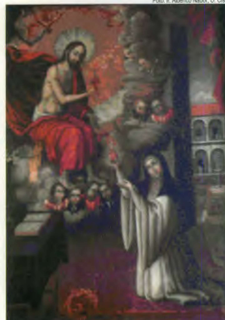
Santa Gertrudes, pintura cusquenha Mosteiro de São Bento, RJ

No século XVII o mundo havia renascido para a humanidade com as descobertas e as conquistas dos séculos anteriores, que faziam o homem se sentir cada vez mais dono de si