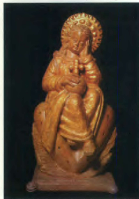
Menino Jesus, escultura em barro Frei Agostinho da Piedade, século XVII Mosteiro de São Bento, Olinda

À guisa de Revelação, enquanto ditava o Velho Testamento, Deus preparava os corações dos homens para receber o Filho consubstancial ao Pai e ao Divino Espírito Santo e começava a revelar o mistério da Trindade, ou seja, a relação do Pai com o Filho e vice-versa, consolidada pelo Espírito de Amor. Portanto, percorrendo as páginas do Antigo Testamento, encontramos textos que nos apontam diretamente para uma devoção antropomórfica do Coração de Deus, o Pai. Antropomórfica porque, embora tendo Ele criado o homem à Sua imagem e semelhança, Ele, Deus, é espírito puro, e como tal, desprovido do coração de carne com que dotaria o Seu próprio Filho no decurso da História da Salvação. Assim sendo, podemos dizer que a devoção ao Sagrado Coração de Jesus é gerada no bojo das Escrituras Veterotestamentária, portanto, antes mesmo do mistério da Encarnação.