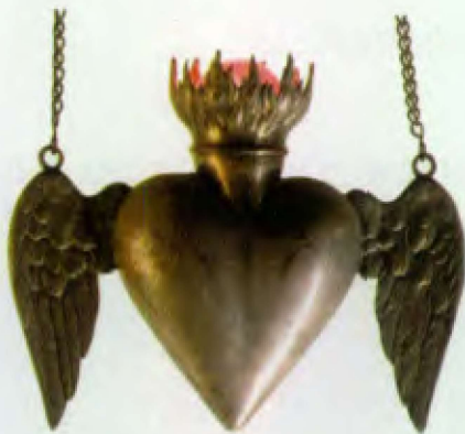
Lâmpada votiva, prata fundida, puxada e cinzelada Fins do século XVII